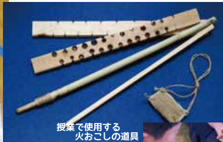
授業で使用する 火おこしの道具

木の板と木の棒というシンプルな道具で火種をつくり、火をつけます。火おこしの難しさや、協力して作業することの重要性を学びます。