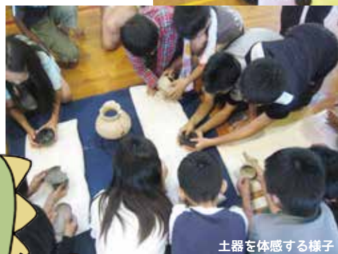
土器について学ぶ