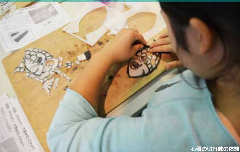
石器の切れ味の体験

弥生時代には刃物として石の道具が使われていました。果たして本当に切ることができるのでしょうか。