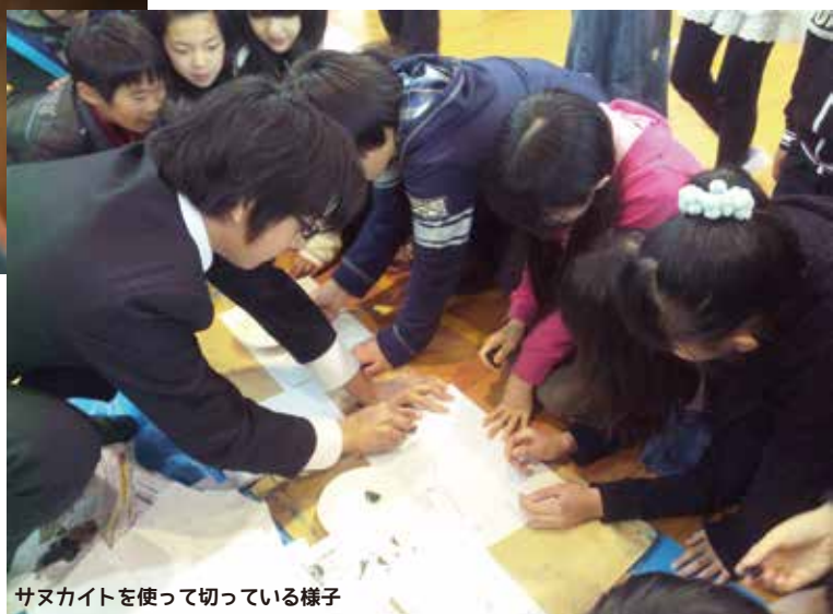
サヌカイトを使って切っている様子