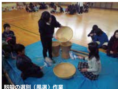
籾殻の選別（風選）作業