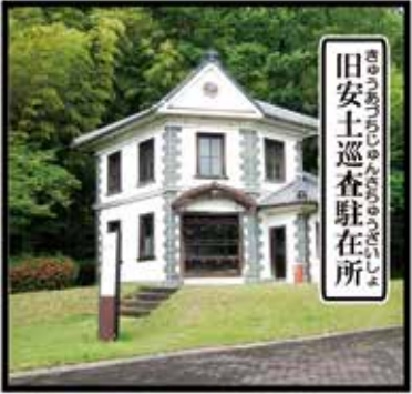
旧安土巡査駐在所