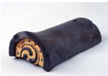
安土城金箔瓦（滋賀県教育委員会蔵）