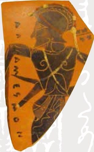
文字入り黒像式陶片 ギリシア 前6～5世紀 神奈川個人蔵