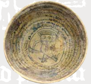
アラム文字銘呪文鉢 メソポタミア 4～5世紀頃 平山郁夫シルクロード美術館

本展のテーマは、文明が誕生したところの中近東やエジプトからシルクロード、そして日本列島まで、ユーラシア世界の文字がたどった数奇な運命——5000年にわたる文字の歴史です。30種以上の文字たちを記した東西の考古・歴史・美術資料が紡ぐ物語をご堪能ください。